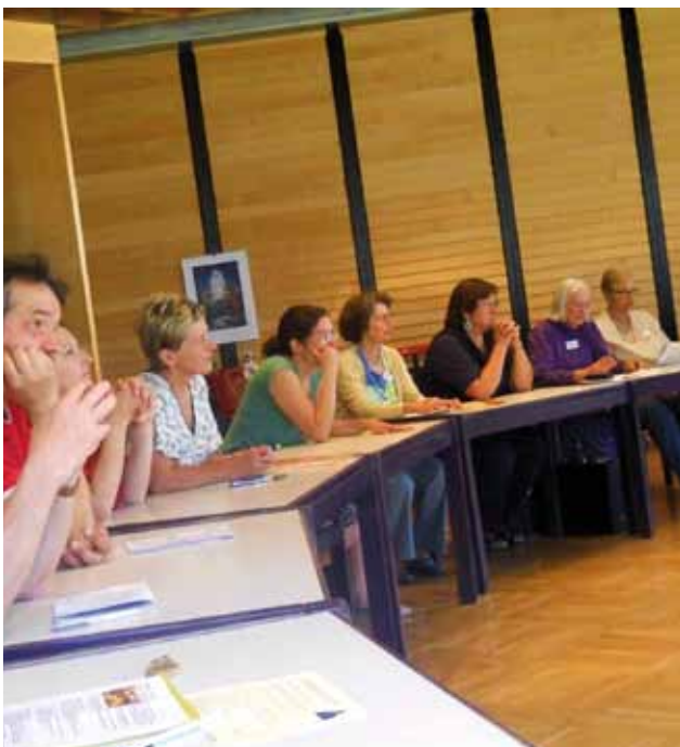
Het internationale lekenforum

Voor dit grensoverschrijdende werk van onze kerken rekenen we op uw bijdrage. In alle tweehonderd oud-katholieke parochies in Europa zal deze maand voor het werk van de Unie van Utrecht worden gecollecteerd. Het zal met name worden besteed voor de opbouw van oud-katholieke missie in Frankrijk, België, Kroatië en Bosnië-Herzegovina. Wij hopen dat ook u het werk van de Unie van Utrecht royaal wilt gedenken.