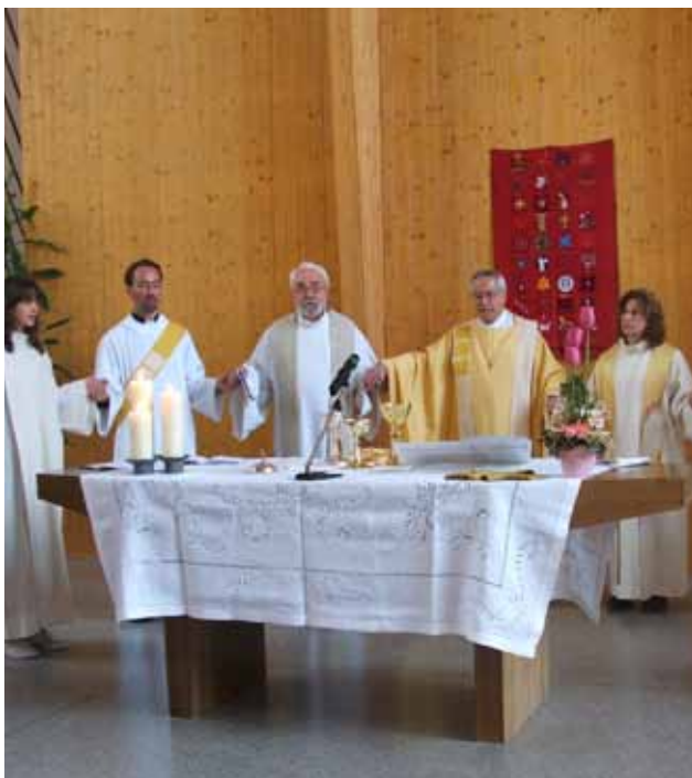
Ontmoeting van oud-katholieke gemeenten uit Frankrijk en Zwitserland