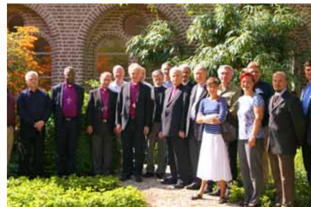
Internationale Bisschoppenconferentie in Amersfoort, mei 2011

Binnen onze beperkte mogelijkheden proberen we op een kwalitatief goede manier aanwezig te zijn in de oecumene. Via projecten met andere kerken zoekt de Unie naar nieuwe partners om ons onafhankelijk katholieke geluid te laten horen.