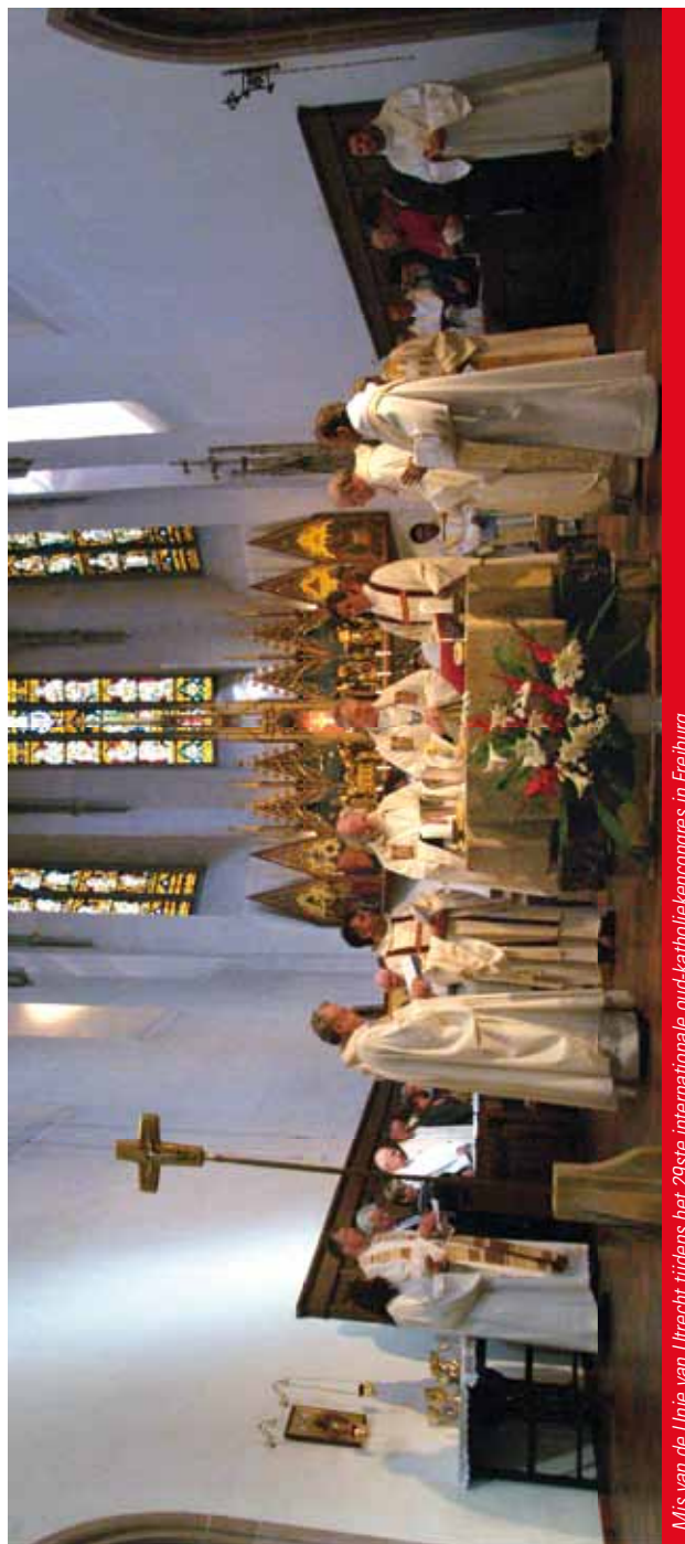
Mis van de Unie van Utrecht tijdens het 29ste internationale oud-katholiekencongres in Freiburg